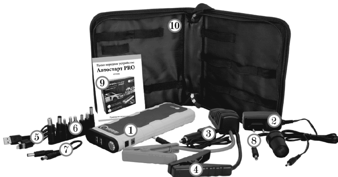
Рис. 1. Комплект поставки Автостарт PRO.