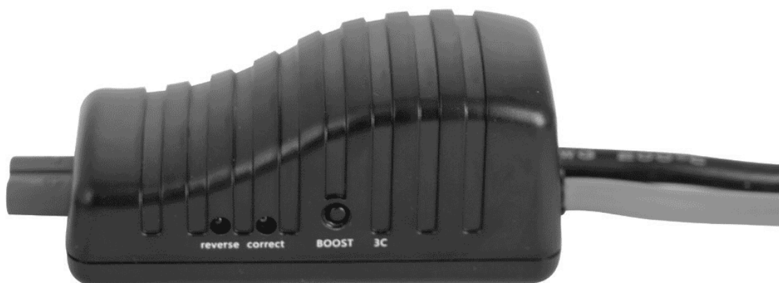
Рис. 3. Блок защиты.

7) После запуска двигателя отключите блок защиты с проводами-«крокодилами» от Автостарт PRO и аккумулятора.